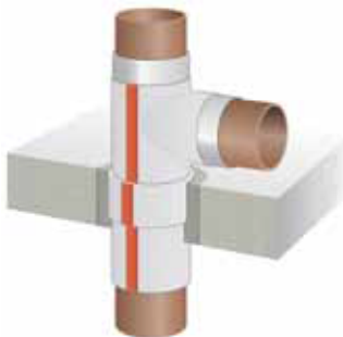
Montage in Massivdecke mit Formteilen